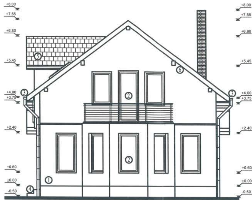
FATADA PRINCIPALA - SCARA 1:100