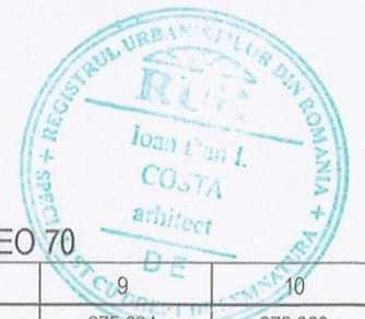
TABEL COORDONATE STEREO 70